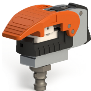
Luftblastexturier- düse der Firma Heberlein AG

Das angewandte Vorgehen der automatisierten Geometrieoptimierung war in diesem Projekt sehr gut auf die Problemstellung zugeschnitten. Wir gehen davon aus, dass Produkte verschiedenster Industriezweige auf diese Art verbessert werden können.